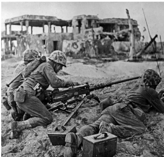
2. svetová vojna

Takto plynuli dni, mesiace... Nič sme nevedeli o udalostiach okolitého sveta.