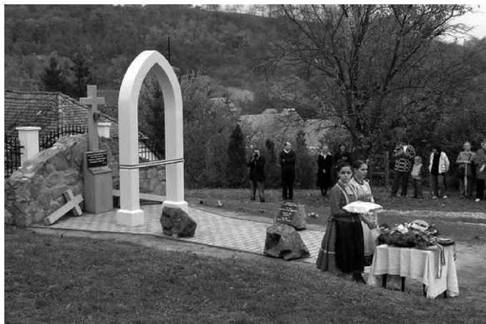
Odhalenie pamätníka v Mórágyi

sa nevrátili na rodnú hruď, do vlasť svojich predkov. Z Tomášova, počnúc septembrom 1948, vysídliť 38 rodín. Ich mená sú zvečnené na mramorovej tabuli umiestnenej v kostole. Väčšina tomášovských rodín sa dostala do Mórágy, v Tolnianskej župe. V ich domoch sa usídlili prisťahovalci z Maďarska. Okrem domov dostali aj majetok pôvodných obyvateľov. Mórágy mal v roku 1930 presne 2 029 obyvateľov. V súčasnosti ich má asi 850. Ťažké časy, ustavičný boj o moc a majetok sa odzrkadlili aj v histórii Mórágy. Namiesto Maďarov zahynuvších v boji s Tatármi a Turkami sem v minulosti prišlo srbské obyvateľstvo. Neskôr, v prvej polovici 18. storočia pribudli ľudia z nemeckých oblastí a o dve storočia neskôr tu našli