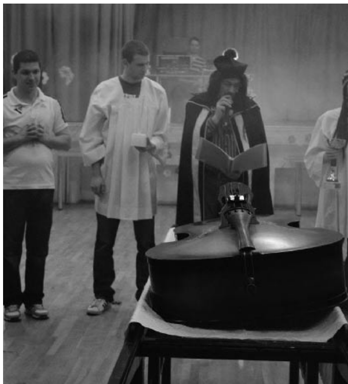
Pochovávanie basy

Už tradične organizujeme popri Stavaní mája aj akciu Deti rodičom, rodičia deťom. Deti v školách vyrábali rôzne produkty a rodičia ich kúpou podporili jednotlivé školy. Ciele tejto akcie boli dva: prezentovať šikovnosť a zručnosti detí a ich učiteľiek a finančne podporiť školy. Výrobky boli nápadité, pestrofarebné, praktické a aj na okrasu. Deti použili kúpený