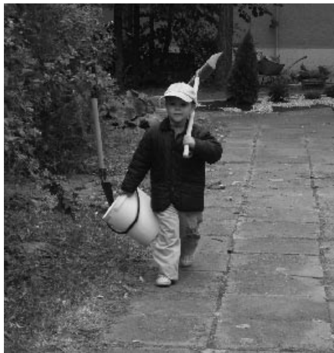
Pri práci pomáhali aj najmenší

Vysadili sme dreviny a trvalky do záhonu, ktorý sme prikryli textíliou a zasykali vymývanými kameňkami. Dreviny a kríky sme vysadili aj v ostatných častiach areálu MŠ. Upravili sme terén a dosiali trávnu. Vyčistili sme chodníky od trávnatého porastu,