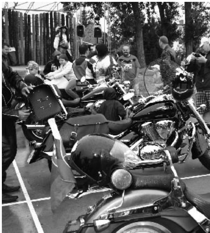
Motorosok, gyerekek és kalózkok - az idei gyermeknap is jól sikerült

A májusfaállítás mellett immár hagyományosan megszervezzük a Gyerekek a szülőknek, szülők a gyerekeknek című rendezvényt. A gyerekek különböző termékeket készítenek az iskolában, a szülők megvételükkel pedig az iskolákat támogatják. Az akciónak két célja van: bemutatni a gyerekek és tanáraik ügyességét, illetve pénzügyileg támogatni az iskolákat. A termékek ötletesek,