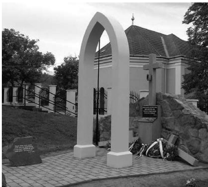
Az emlékmű és ünnepélyes átadása

a munkabíró személy, főleg a férfi. Csehországból a többség pár év múlva hazajött és idővel vissza is kapták házuikat, vagyonukat.