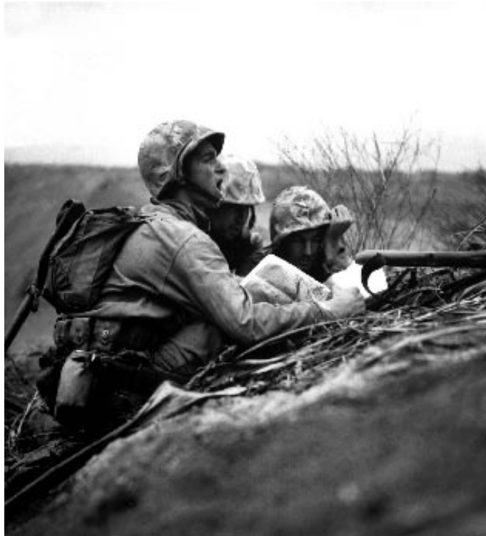
A II. világháború (Illusztrációs felvétel)

Így teltek a napok, hónapok. Semmit sem tudtunk a külvilág eseményeiről. Napi táplálékunk egy kanál