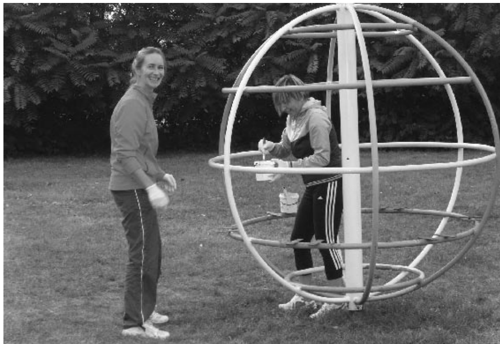
A szülők is kivették részüket a munkából

Célunk, hogy attraktív és biztonságos szórakozási és játékszónát alakítsunk ki a gyerekek számára, felújítsunk néhány régebbi játszótéri elemet, takaróssabbá varázsoljuk az udvar környékét, és ilyen módon növeljük az óvoda aktivitását a szülők és gyermekek számára. Így megfelelő körülmények között fogják tudni fejleszteni adottságaikat, készségeiket. Jó adag munka van mögöttünk, amit szeretnék megköszönni a szülőknek, akik aktívan bekapcsolódtak az óvodaudvar felújításának munkálataiba.