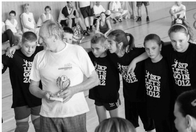
A község segítségét eredményeinkkel kívánjuk meghálálni, melyekkel Fél propagáljuk.

Az iskolaterv keretén belül a diákok három színházi előadást láttak, az iskolai és községi rendezvényeken 12 kultúrprogramot mutattunk