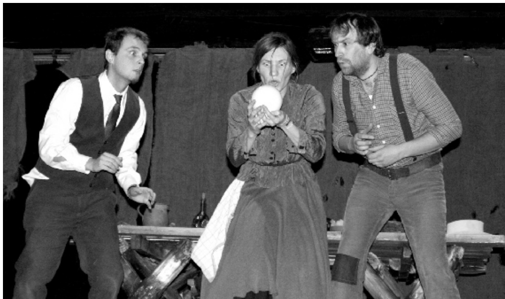
Az amatőr színjátszás új távlatokat nyit

Aki ismeri a magyar kultúrát, tudja, hogy a színház mindig az alapja volt. Községünkben két nyelven beszélünk, két egyforma