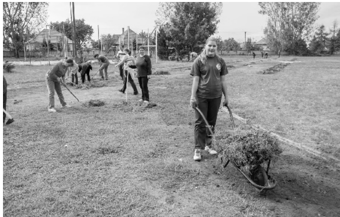
Nem sokan, de annál lelkesebben

A brigád szombat reggel kezdődött. A szülők fokozatosan érkeztek, mindenki valamilyen szerszámmal. A munkába a gyerekek is bekapcsolódtak. Összesen kb. 50-en gyűltünk össze. Ezt kissé keveselltem, ám egy ilyen csoport is sokat megtehet. Egy idő után viszont megdöbbenve álltam. Nem a munka miatt, amit rám osztottak, hanem a csalódottság miatt. Ebből a létszámból a szlovák iskolát hat szülő és egy gyerek képviselte. Hadd ne hasonlítsam össze a két iskolát látogató gyerekek és a segítőkész szülők arányát, ezt önök is ki tudják számolni.