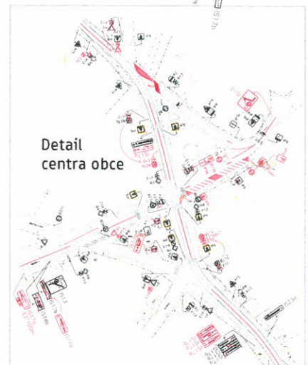
Detail centra obce

Výkres navrhovaných úprav dopravného značenia